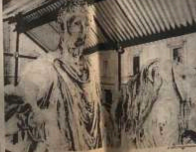
Remoción Marco Arellano. La remoción de Marco Arellano es una obra que muestra la evolución de la escultura clásica y moderna. La obra es una muestra de la capacidad del artista para conectar con el público a través de un lenguaje escultórico innovador.

Una exposición de pinturas al óleo en la galería "San Lucas". La exposición muestra una serie de obras que exploran temas religiosos y sociales. Las pinturas están realizadas con técnicas tradicionales y muestran un alto nivel de detalle y color. La galería "San Lucas" es un espacio ideal para apreciar el arte al óleo en un ambiente tranquilo.