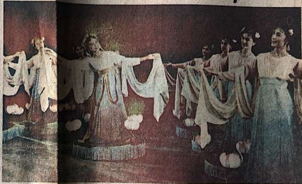
"Flores de Loto", una de las principales danzas montadas por el conjunto Central de Danzas y Canciones de la China popular, que se encuentra actualmente

El colorido y majestuosidad de los trajes, los ritmos y limpios movimientos que podemos apreciar en un ensayo unidos, a través de los compases de una música de fantasía, prometen constituir este espectáculo en uno de los más vistosos y fantásticos de los que nos han visitado en los últimos tiempos.