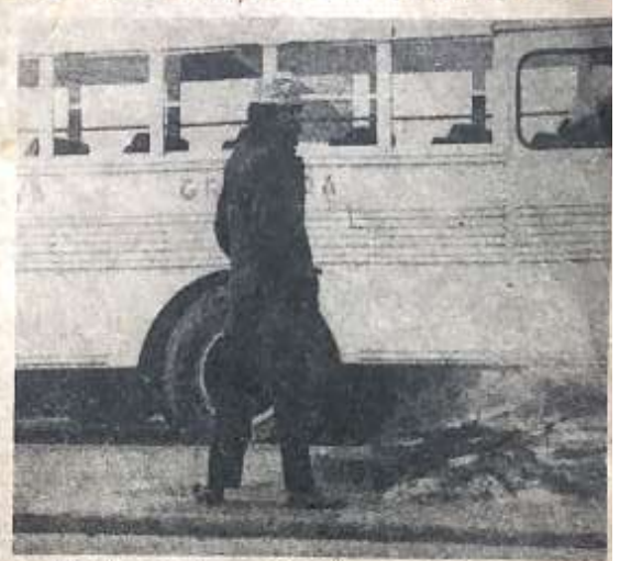
Este enfermo mental opera en la calle 72 con Avenida Caracas. Al anochecer enciende una hoguera para dar co-

destruidos y la violencia, además, el hecho de ocurrir en Colombia los mismos síntomas muy particularmente como el caso de la violencia, la migración campesina al alcoholismo y las guerrillas, entre otros. Vamos ahora a estudiar los factores familiares, sociales, que viven en condiciones de miseria, donde las relaciones familiares son muy malas y no hay el afecto y la