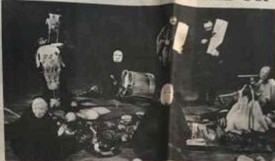
Letrado colombiano y afilados instrumentos musicales prepararon el escenario para la obra "Yaki Kandru".