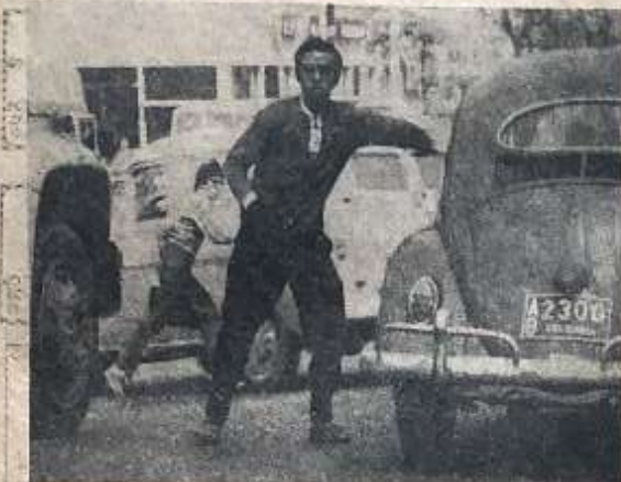
En la carrera 13 con calle 37 tiene su centro de operaciones este demente. Allí se acerca a los automóviles y pide dinero a sus conductores. Cuando no

obtiene nada golpea con sus manos enguantadas a los vehículos, como se puede observar en la fotografía.