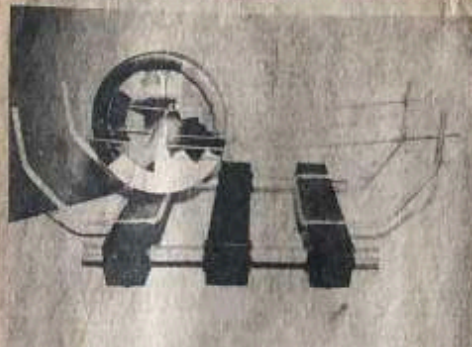
"Popolo" /vital con rotación muestra lo cíclico de los sucesos y de la vida en general.