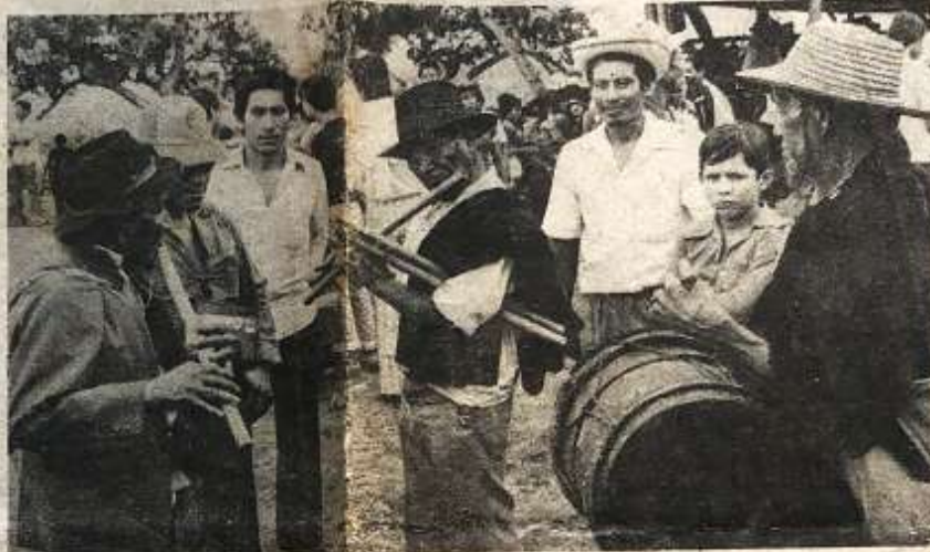
Los músicos guambianos interpretan tonadas autóctonas durante un receso del encuentro nacional indígena.

Un joven del CRIT resumió así lo que entiende del proyecto de Estatuto: "Nos cambian la lengua por una alpargata". Lo anterior, podría hacer pensar que los indígenas se oponen a las leyes. Pero no. La plenaria del encuentro aprobó luchar porque se